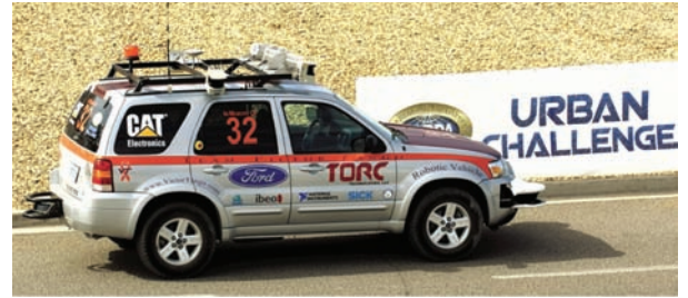
Figura 2. Las FPGAs pueden ayudar a los ingenieros a crear algoritmos de percepción y planificación avanzados y de alto nivel de los vehículos autónomos.

Al diseñar el prototipo, merece la pena desarrollar el proyecto de manera que la mayor parte de la IP pueda ser reutilizada en el diseño final. Se deben considerar un par de factores: anticipar el número de despliegues y el mercado donde el robot será desplegado. Los