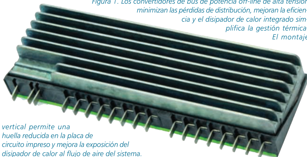
Figura 1. Los convertidores de bus de potencia off-line de alta tensión minimizan las pérdidas de distribución, mejoran la eficiencia y el disipador de calor integrado simplifica la gestión térmica. El montaje

vertical permite una huella reducida en la placa de circuito impreso y mejora la exposición del disipador de calor al flujo de aire del sistema.